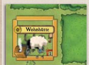
In dieser Wohnhütte wohnt (neben den drei Arbeitern des Spielers) 1 Schaf.

Durch das Sondergebäude „Fachwerkhaus“ ( siehe Seite 8 ) könnt ihr die Wohnhütte ausbauen und auf diese Weise noch mehr Tiere unterbringen.