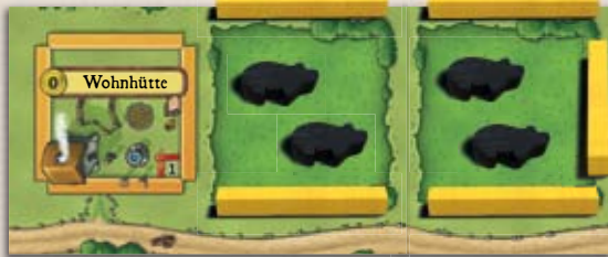
Auf dieser Weide ist Platz für bis zu 4 Tiere der gleichen Art.

Mit den länglichen Grenzteilen steckt ihr Weiden ab. Auf jeder vollständig umschlossenen Weide könnt ihr pro Hoffeld bis zu 2 Tiere halten. Auf jeder Weide können immer nur Tiere der gleichen Art gehalten werden.