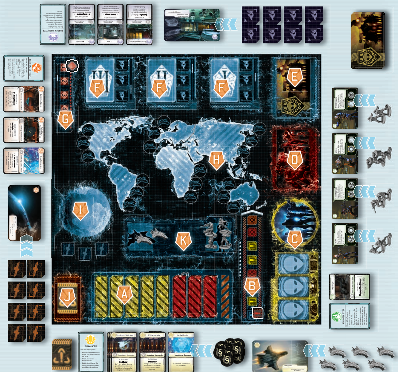
ABBILDUNG: SPIELPLAN UND SPIELAUFBAU