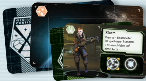
7 RESERVEKARTEN (IN ZWEI GRÖSSEN)