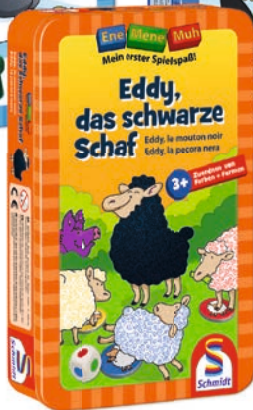
Art.- Nr. 51290