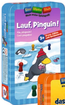
Art.- Nr. 51291