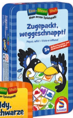
Art.- Nr. 51293