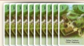
Stapel mit Siedlungskarten