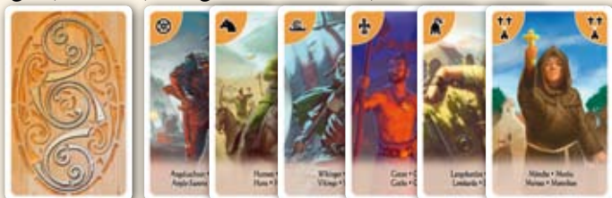
Rückseite Angelsachsen, Hunnen, Wikinger, Goten, Langobarden & Mönche