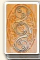
Stapel mit Völkerkarten