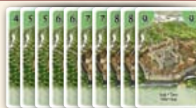
Stapel mit Stadtkarten

Ein Spieler kann in seinem Spielzug in dieser Reihenfolge Folgendes unternehmen: