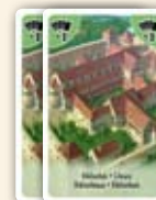
Stapel mit Bibliotheken