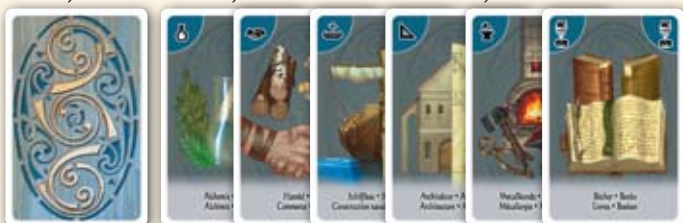
Rückseite Alchemie, Handel, Schiffbau, Architektur, Metallkunde & Bücher