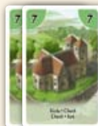
Stapel mit Kirchen