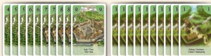
Stapel mit Städtekarten

Der älteste Spieler wird Startspieler; die anderen Spieler folgen im Uhrzeigersinn.