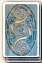
Stapel mit Zivilisationskarten