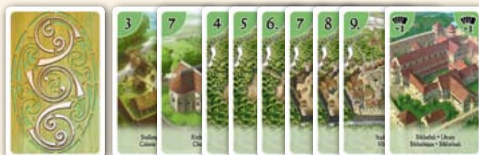
Rückseite Siedlung, Kirche, Städte, Bibliothek