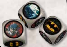
7 Würfel: 3x grau, 4x schwarz