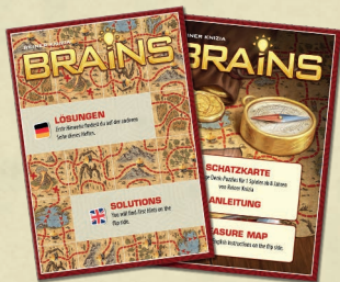
1 Heft mit ersten Hinweisen und Lösungen