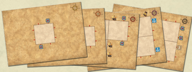
25 Puzzle-Tafeln - beidseitig bedruckt