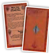
Der Schatten (3)