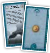
Freie Völker (20)