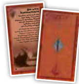
Der Schatten (6)