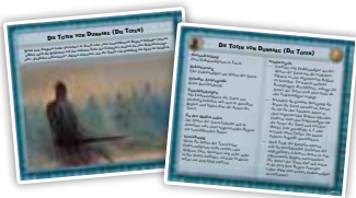
Freie Völker (3)