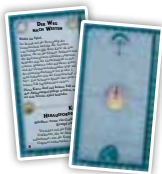
Freie Völker (6)