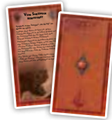
Der Schatten (20)