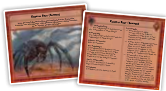
Der Schatten (3)