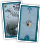
Freie Völker (6)