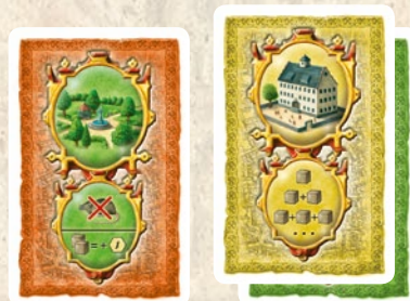
die erste Karte

Reihum zwei der drei Aktionskarten ausspielen und dritte ungenutzt abwerfen