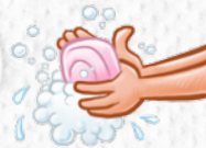
4) Hände waschen