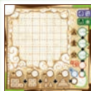
100 beidseitig bedruckte Abenteuerpläne (Die Rückseite zeigt ein anderes Tal.)

Ersatzteilservice: Du hast ein Qualitätsprodukt gekauft. Falls ein Bestandteil fehlt oder ein anderer Anlass zur Reklamation besteht, wende dich bitte an: