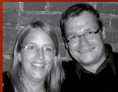
Illustration: Rolf Vogt AR.VI